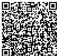
Ergebnisse Jg. 3